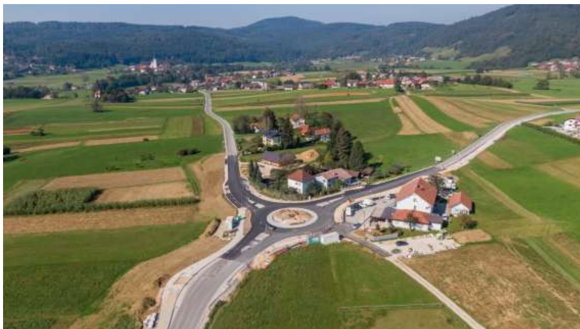
Slika 2: Krožišče Gabrovčec

V luči kakovostnega urejanja občine si želi Občina Ivančna Gorica urediti tudi otok novega krožišča, kateri bi pripomogel k prepoznavnosti in celoviti ureditvi prometne infrastrukture. Ureditev krožišča naj temelji na sodobnem oblikovanju, trajnostnem razmisleku ter prepoznavni identiteti kraja, Krajevne skupnosti Krka, ter širšega prostora, občine Ivančna Gorica oziroma Suhe krajine.