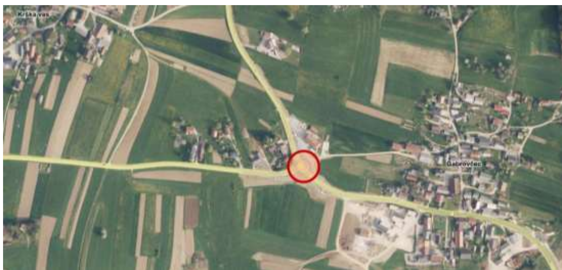
Slika 1: Lokacija krožišča

Leta 2024 je bil na križišču regionalne ceste R1 1367 Ivančna Gorica - Krka, regionalne ceste R3 1174 Mlačevo - Krka in regionalne ceste R1 1175 Krka – Žužemberk, v naselju Gabrovčec, zgrajeno novo krožno križišče. Premer notranjega kroga krožišče je 17,5 m.